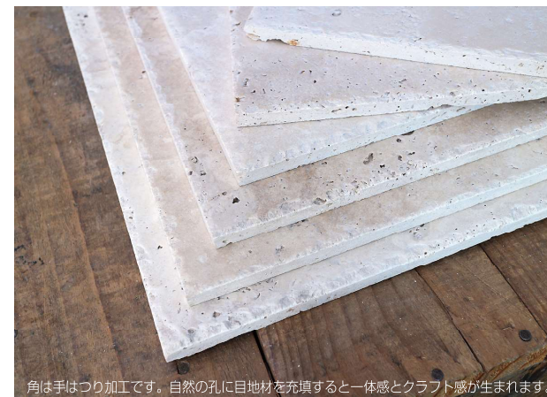
角は手はつり加工です。自然の孔に目地材を充填すると一体感とクラフト感が生まれます。